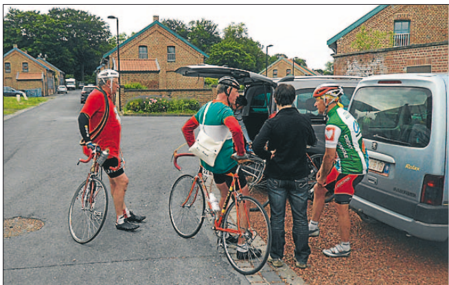
Retroryttere til start på løbet med gamle hjelme, remme på pedalerne og ekstra dæk over skuldrene.