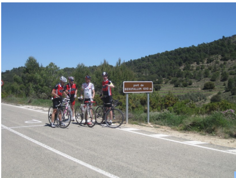
Figur 3 Endnu et 1000 meter bjerg besteget

De første par dage benytter vi os af de store hovedveje omkring Albir på vej ind i landet. Vi finder dog snart ud af, at der er små veje vi kan benytte. Det er nu ikke et problem at køre på de store veje, da der er