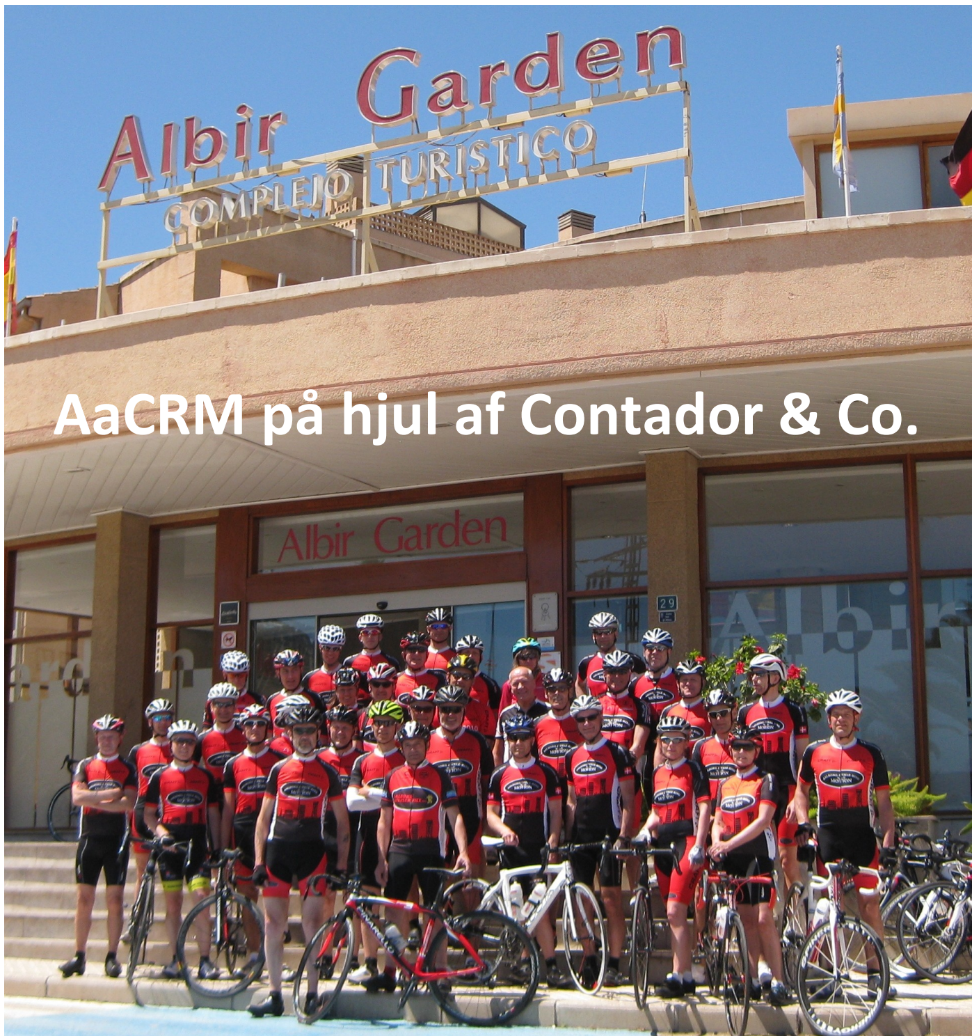
Figur 1 AaCRM foran hotellet er klar til første tur

Costa Blanca, Alicante og den spanske østkyst det må være grisefester, betonhoteller og badedyr! Sådan var min klare overbevisning – eller måske rettere fordom. Indtil foråret 2014.