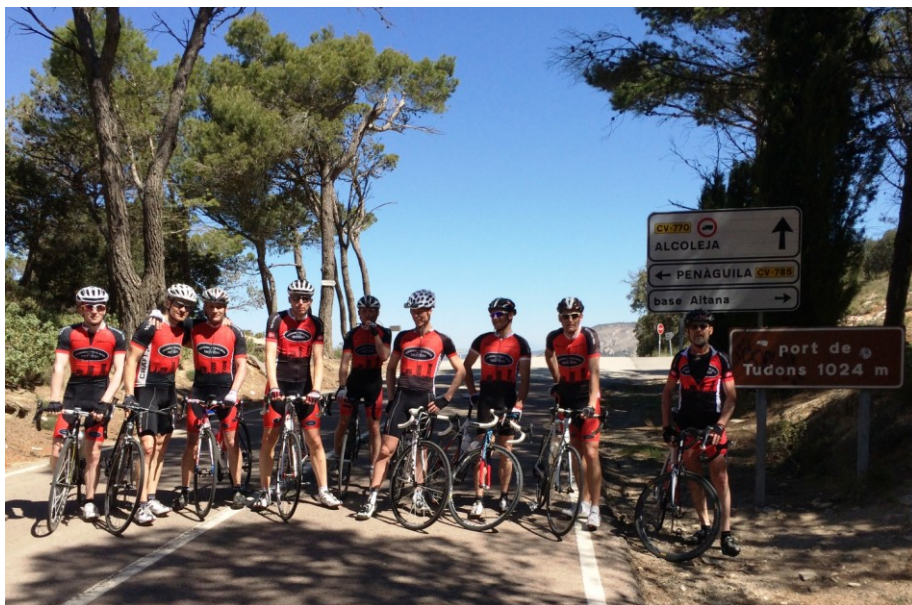
Figur 5 Hold 1+ på toppen af den klassiske Tudons stigning

Et par af de klassiske pas kommer vi over flere gange i ugens løb. Bl.a. Port de Tudons og Coll de Rates, der benyttes som testbjerge