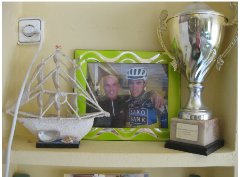
Figur 6 Fra cafeen i Alcoleja