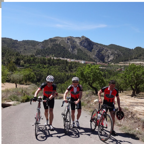
Figur 4 Nogle gange skal man give sig god tid til at nyde landskabet