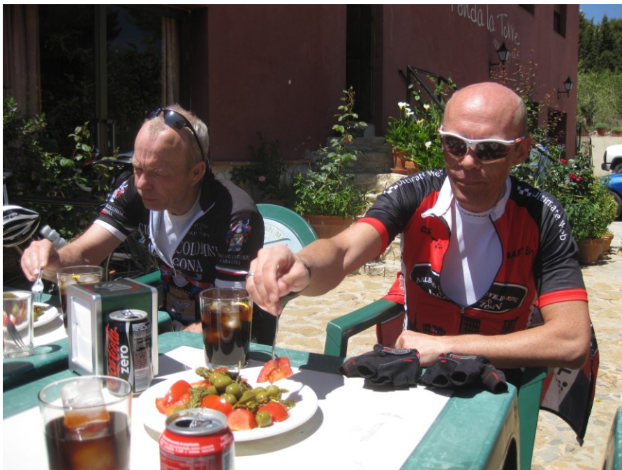
Figur 7 Mens vi venter på turens bedste sandwich

småsov ude ved vejen, og bagved kunne vi se nogle borde. Vi var i tvivl om der var åbent, så vi satte os alle 11 for at se om der skete noget. Den midaldrende mand gik ind i huset, og ud kom en midaldrende kvinde. Vi fik bestilt sandwich m.v.. Herefter fik vi nogle lækre snacks – oliven, tomat m.v.. Samtidig blev der livlig trafik af biler der kom, en af dem med brød. Det var de bedste sandwich på turem, og det siger en hel del.