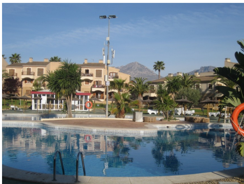
Figur 2 Albir Garden indenfor

Hotellet er vant til at have med sportsfolk at gøre, så vi kan få det som vi ønsker. Hotellet har erfaring med cykelhold, da adskillige professionelle cykelhold bruger det under vintertræningen i december, januar og februar. Under Vueltaen i 2011 boede mange af cykelholdene også her under de etaperne i området.