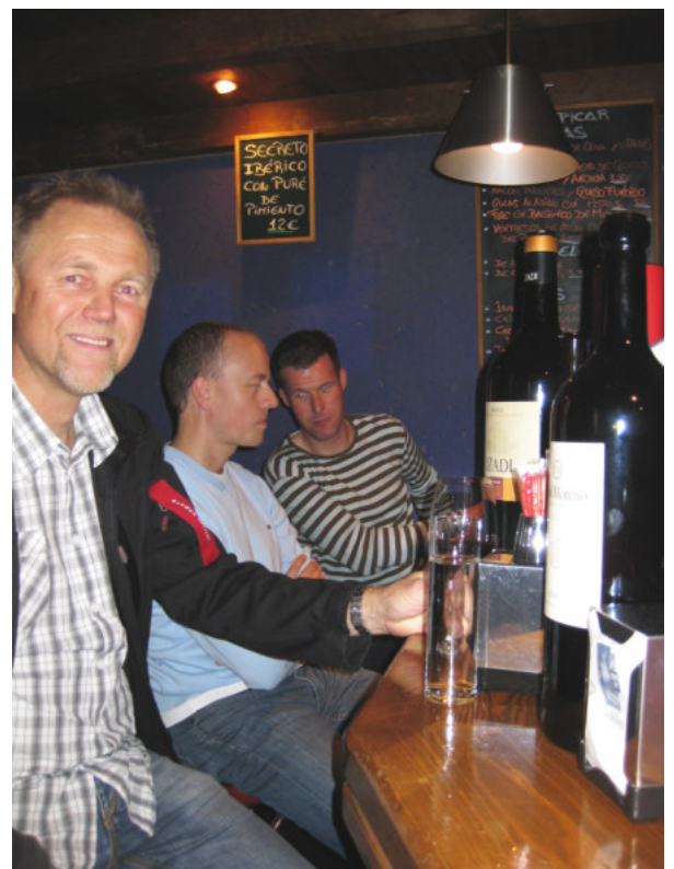
På vinbar lørdag aften