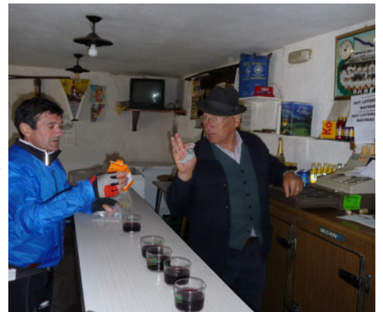
Vi køber vin til ½ €.

Aftensmaden byder denne aften på en lækker fiskesuppe (skaldyr). Det er vi i hvert fald nogen som synes, mens der er nogle mere skeptiske mellem os. Hovedretten er noget vel-smagende Gulays-lignende med kartoffelbåde og salat. Desserten er pære.