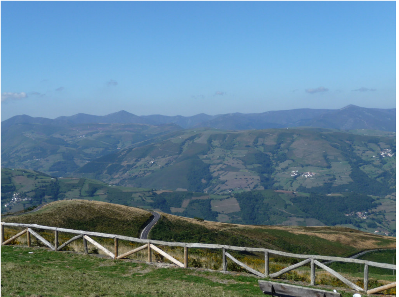
Udsigt fra Santuario del Acebo.