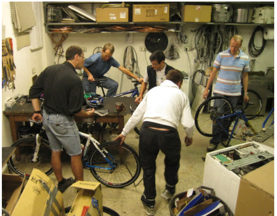
Samling af cykler.

Efter morgenmad samler vi cyklerne. Det er ikke nogen helt let opgave da et par af os er cykelmaterielle analfabeter.