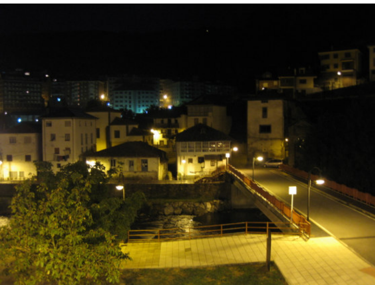
Aftenudsigt fra hotel.

Det er ikke de store lysreklamer, som præger byen, men der er masser af gå-ud-steder. Vi finder en lille vinbar med cirka 20 pladser, og starter testen af spanske drikkevarer. Vi er et par stykker,