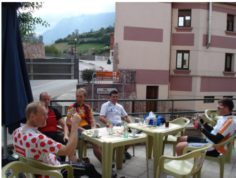
På Cafe ved foden af Angliru. Intet alkohol på bordet!

Starten er Angliru er ganske human. De første 5,8 km stiger det i snit 6,6 %, men det varierer noget, der er et