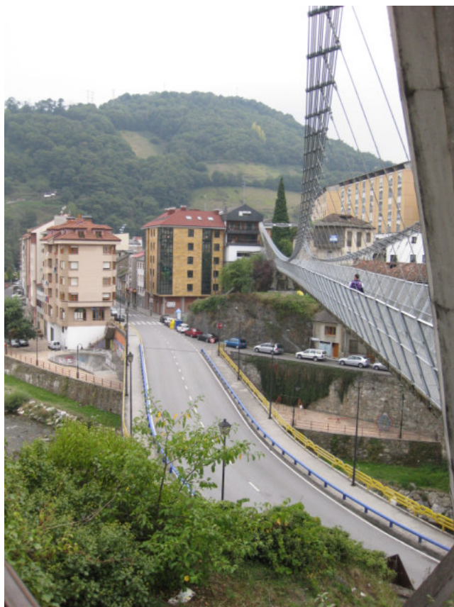
Hængebroen i Cangas. Den er ikke lige populær hos alle!

Mandag et mountainbike-dag, så vi starter med alle at få monteret terrændæk. Dagen bliver delt i to ture med udgangspunkt i Cangas – en formiddagstur på cirka 50 km, og en eftermiddagstur på cirka 20 km.