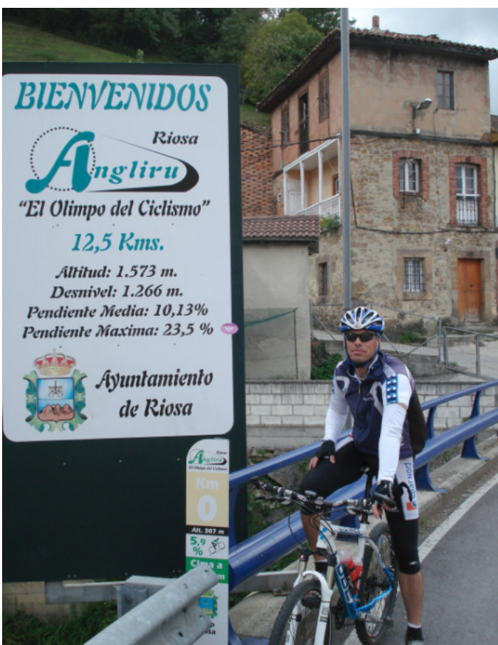
Velkommen til Angliru.

vejen er smal, så der er ikke mange muligheder for at få lidt luft. Der er løbende skilte med hvor stejlt det følgende stykke er, hvilket absolut ikke er nogen fordel efterhånden som benene begynder at protesterer.