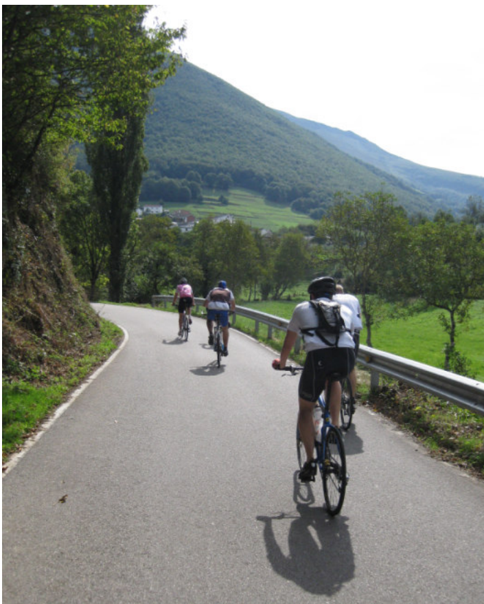
Start på turen mod Genestoso.

Vejret er fint med letskyet vejer og cirka 20 grader. De første 10 km er det ad flad vej, men derefter går det op ad bakke. Cangas ligger omkring 300 meter over havet, og Genestoso ligger i cirka 1300 meter, så det går noget opad ind imellem. Det er en flot tur op igennem en dal, med få landsbyer. Undervejs ser vi en række klassiske opbevaringshuse, som står på fire søjler for at beskytte med rotter, mus og lignende. Mange af husene i landsbyerne er meget gamle, flere hundrede år.