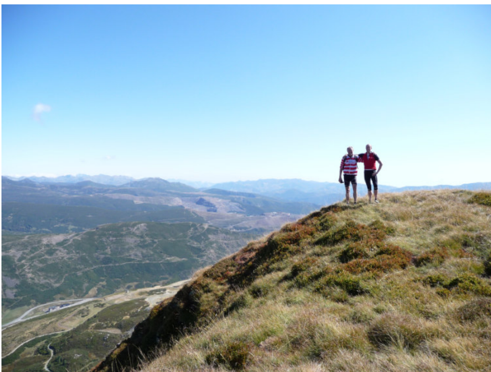
På toppen, Cueto de Arbas i 2009 meters højde.

Fra søen går vi nu opad i en times tid til toppen, Cueto de Arbas, som ligger i 2009 m højde. Fra toppen er der en fantastisk udsigt 360° rundt. Vi kan næsten se hele Asturien. Der er bjergtoppe hele vejen rundt.