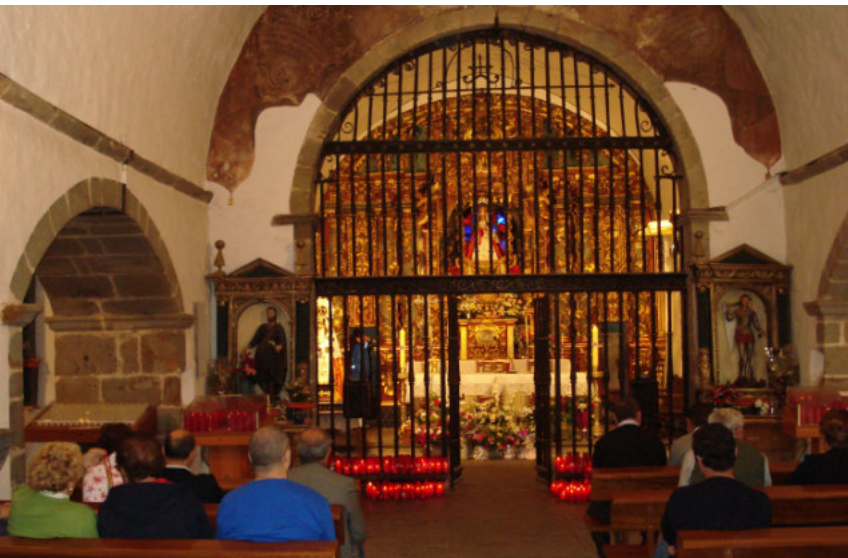
Kirken på toppen.