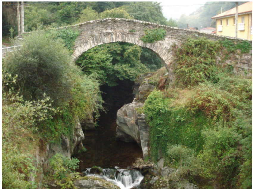
En bro fra romertiden.