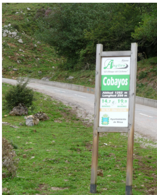
Skiltene med næste del af stigningen. Ikke altid behagelig læsning!

Efter de første 6 km har taget toppen af energien, begynder det "sjove". De sidste 6,7 km er 12,9 % i snit, men det inkluderer et par flade partier, så vi får rigtigt vores sag for! Der er ikke så mange sving, og